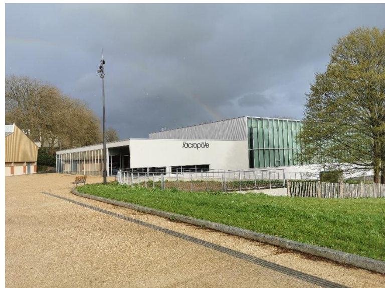
VUE DE L'ENTREE DE LA SALLE DE COMPETITION