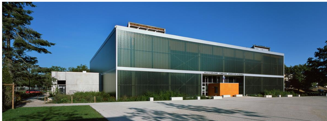
Complexe sportif de La Source, Rue Alain Fournier, 45100 ORLEANS Tél : 02 38 25 98 37