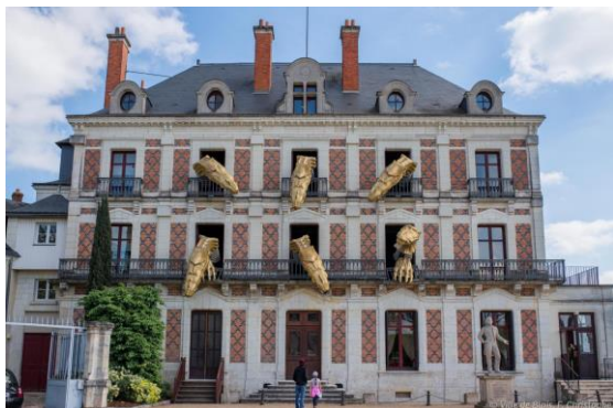
Maison de la Magie Robert Houdin