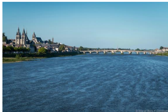
Bord de Loire – Pont Jacques Gabriel