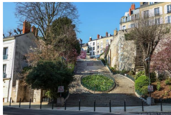
Escalier Denis Papin