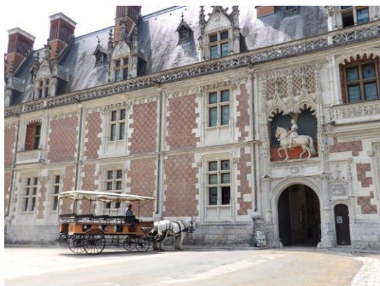
Le Château Royal