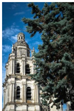
Cathédrale St Louis