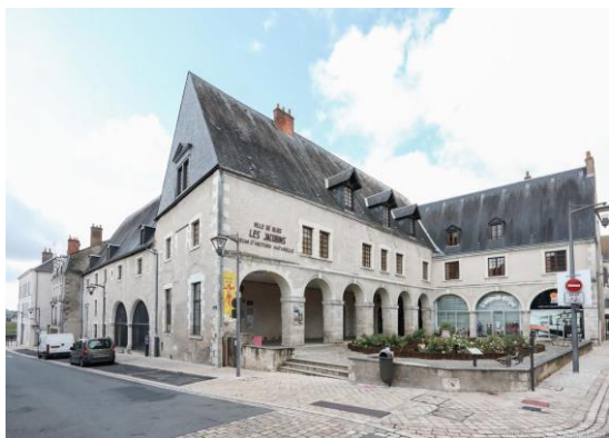
Musée des Jacobins