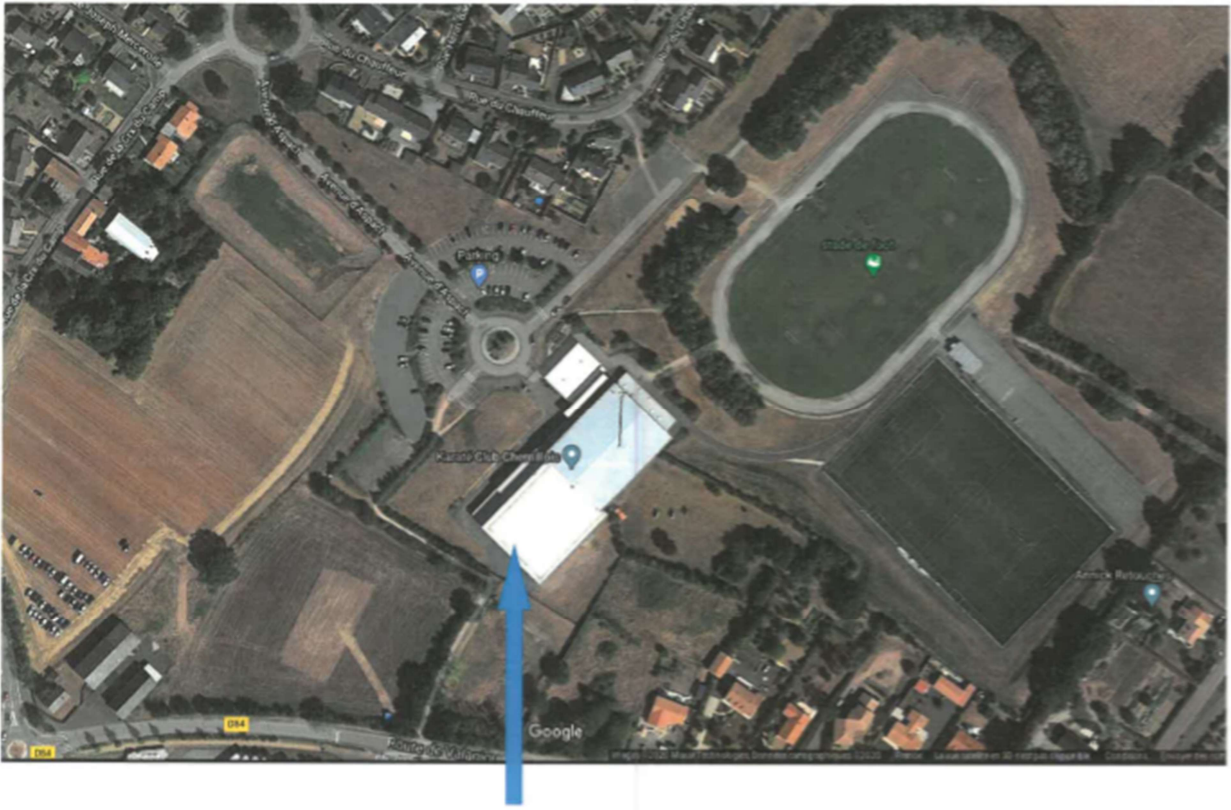
Pa Salle de gymnastique – lieu de compétition : entrée avenue d'aspach 49120 CHEMILLE EN ANJOU